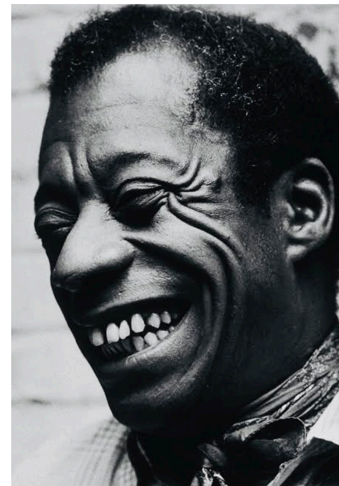
James Baldwin